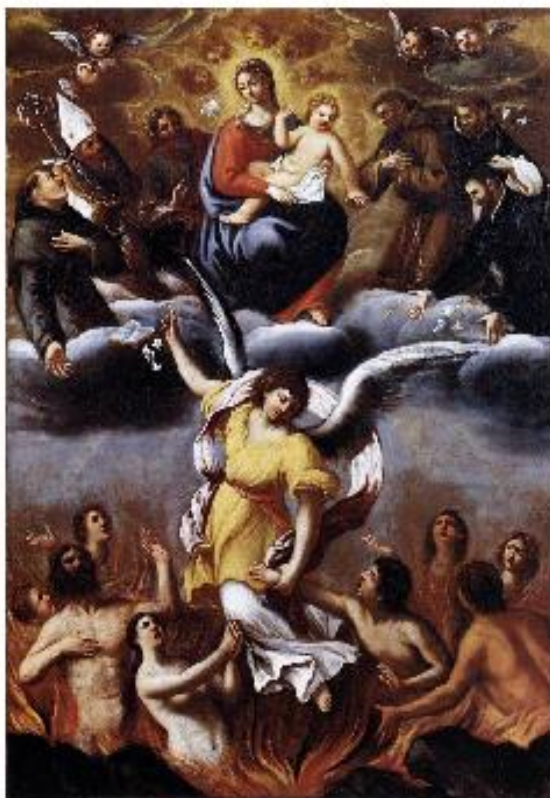
An Angel Frees the Souls of Purgatory By Lodovico Carracci, c.1610 Pinacoteca, Vatican

In Carracci's painting, who is the luckiest person in purgatory? That would be the one whom the angel has by the wrist, pointing upward as if saying, "Your time in purgatory is complete; come join the saints in heaven."