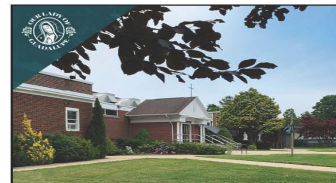
Our Lady of Guadalupe School East Campus 82 Carleton Avenue Central Islip, NY 11722 631-538-0505 Ext. 2