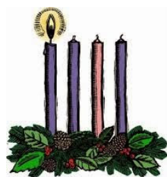
First Sunday in Advent

Make this year's Advent special The Advent wreath is already available to memorialize a deceased loved one or to mark a special occasion in your life or a family member during December Sundays of Advent.