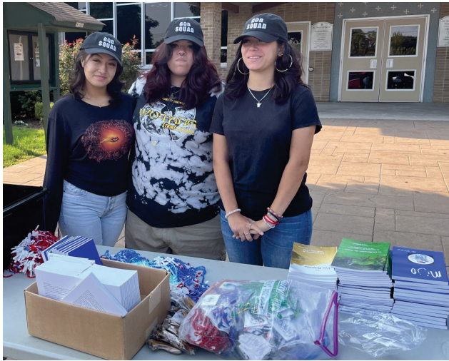
Teens participate in parish "Random Acts of Kindness Day"

All teens grades 8-12 are invited to join our youth group.