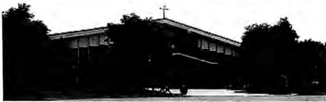
88 2nd AVE BRENTWOOD NY 11717

La communauté Haïtienne vous invite tous à traverser le jardin Gethsémani au Golgotha sous le thème :