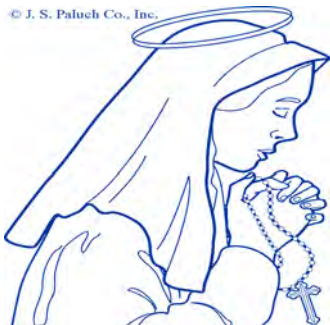
© J. S. Paluch Co., Inc.

En nous donnant son Esprit, le Christ ouvre les portes verrouillées de nos peurs et nous envoie dans notre milieu de vie où nous nous efforçons de créer un monde meilleur, un monde plus humain et plus fraternel.