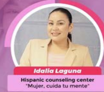
Idalia Laguna Hispanic counseling center "Mujer, cuida tu mente"