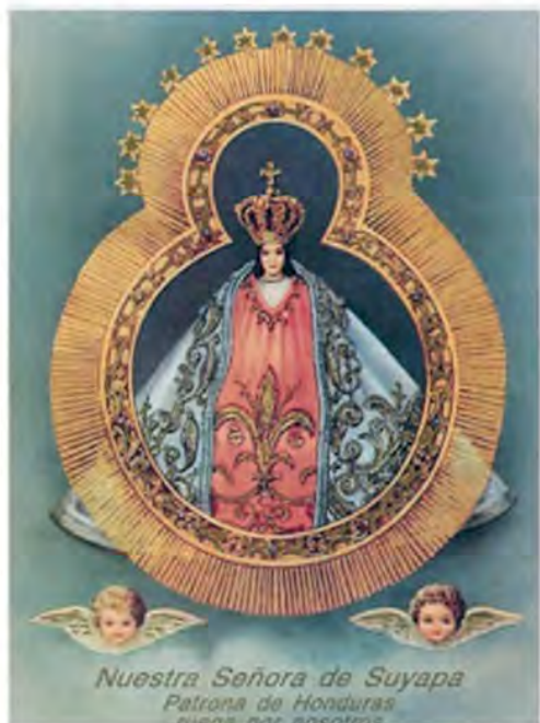
Nuestra Señora de Suyapa Patrona de Honduras ruca por nosotros

LA COMUNIDAD HONDUREÑA LOS INVITA A CELEBRAR