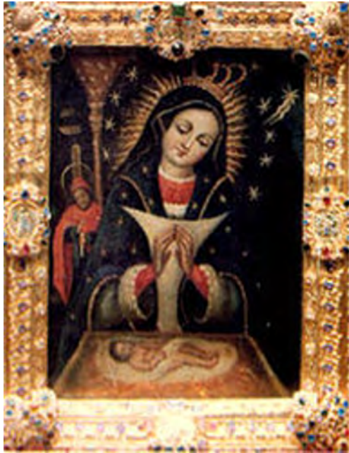
Virgen de la Altagracia Ruega por nosotros

Nuestra Señora de la Altagracia les Invita a todos a la Celebración Sabado Enero 20, 2024 empezando con la Santa Misa a la 7:00PM. Unase a todos los Dominicanos (a) a celebrar a Nuestra Madre Santisima. Invite a todos sus familiares, vecinos y amigos y celebremos juntos Nuestra Señora de la Altagracia este gran dia.